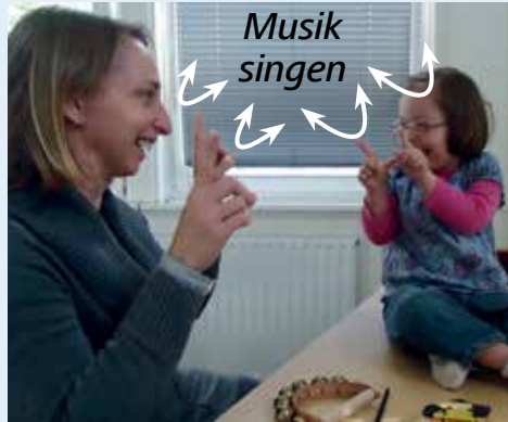
Gebärden erleichtern die Verständigung